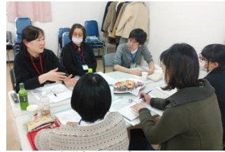
現場の看護師から事例紹介