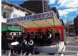
↑地元中学校吹奏楽部 ↑じゃんけんゴール ↑友の会・盆踊り・歌声サークル