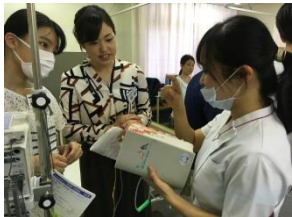
若手看護師からの指導

学校での授業、テスト、実習の予習復習にも役立つ看護実践講座です。 テーマに合わせた国家試験の過去問にチャレンジする事もあります。 講師は現場の看護師や他職種の職員なので勉強方法や実習のアドバイスにものってきます。