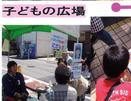
↑子どもえんち ↑ドッグセラピー